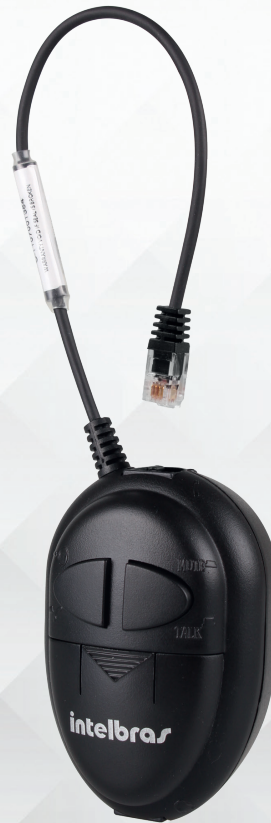
Adaptador de pinagem RJ9