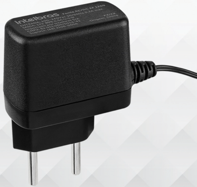
Fonte de alimentação