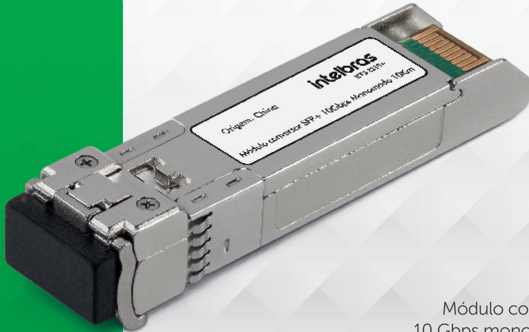
Módulo conversor SFP+ 10 Gbps monomodo 10 km