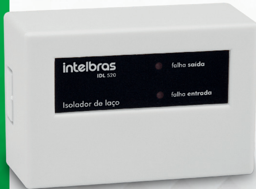
Isolador de laço