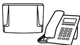
Central Telefônica e Telefone